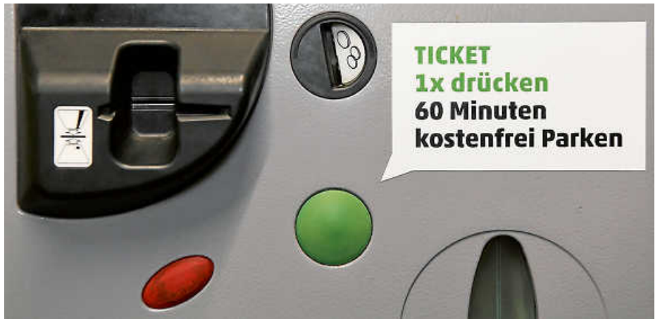
Parkautomat in der Tiefgarage Zehntscheuer mit der grünen „Brötchentaste“, die Bürger und Gästen in Echterdingen eine Stunde Gratis-Parken ermöglicht.

scheuer von großer Bedeutung für Kunden der Geschäfte und Wochenmärkte in der Mitte Echterdingens. In den zentralen Lagen von Echterdingen wird über Banner, Fahnen und Flyer in den Geschäften auf den neuen Bonus hingewiesen, der zunächst bis zum Jahresende 2024 bewilligt worden ist. Mit dem Beschluss des Gemeinderats hat dieser im Übrigen an eine Übereinkunft des Gremiums vom Mai 1999 angeknüpft: Seinerzeit wurde erstmals das kostenlose Parken in der Tiefgarage für die erste halbe Stunde des Parkvorgangs eingeführt. An der Finanzierung der Brötchentaste war von Anfang an auch die Werbegemeinschaft Echterdinger Fachgeschäfte beteiligt. Den Löwenanteil trägt die Wirtschaftsförderung der Stadt. Mit der neuen Regelung betragen die jährlichen Kosten rund 54.000 Euro. (go)