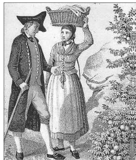
Württembergische Landleute (ca. 1850) v. d. Fildern.