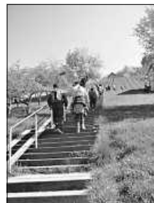
April-Wanderung in einem der Vorjahre in den Metzinger Weinbergen

Unsere Homepage wurde gehackt und ist deshalb vorübergehend nicht erreichbar. Nach ihrer Neugestaltung werden wir unsere Reihe " Wanderquiz " während der Corona-Einschränkungen wie-