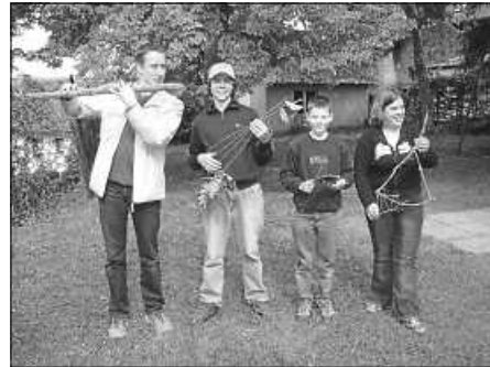
Bläserklasse 2004

Und das soll es auch außerhalb der Proben: Bei Ausflügen oder Kinoabenden und bei unseren Veranstaltungen werden schon die Jüngsten in unser Vereinsleben integriert. Alle Informationen und Anmeldung unter www.mv-stetten.de/blaeserklasse Wir freuen uns auf eure Anmeldung!