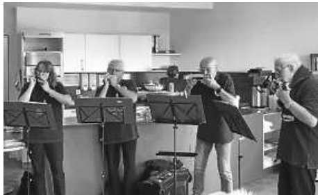
Mundharmonika-Club Beta