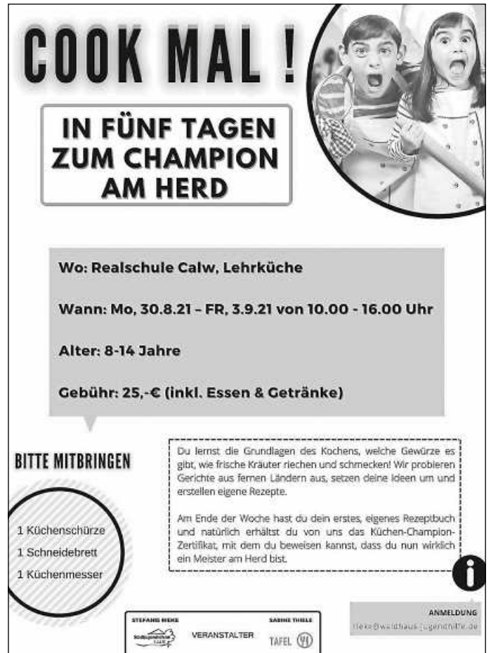
Plakat: André Weiß