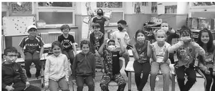
Vorstellung von HEISS AUF LESEN an der Erna-Brehm-Schule

für bis zu 3 gelesene Bücher Bewertungsbögen abgeben und ein Comic zum Thema Superwesen zeichnen. Die Gewinner werden am 24. September ausgelost und anschließend per Telefon, Post oder E-Mail informiert. Ausführliche Informationen findet ihr auch auf unserer Homepage.